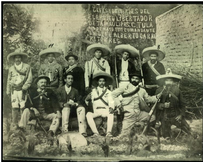
Imagen 4. Jefes y oficiales del Ejército Libertador de Tamaulipas, 21 de mayo de 1911