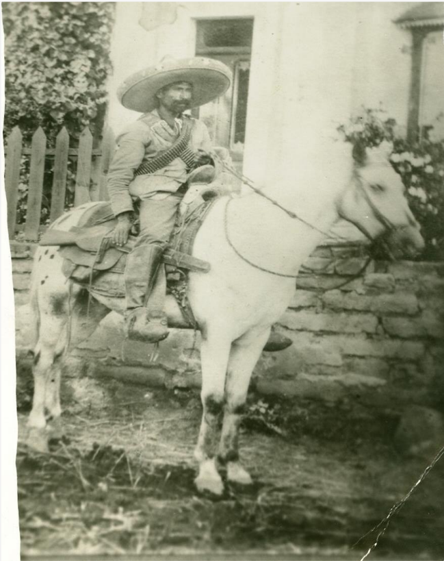
Fondos Documentales Joaquín Meade del Instituto de Investigaciones Históricas de la Universidad Autónoma de Tamaulipas