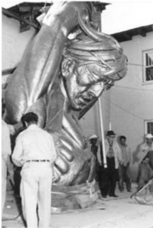
Figura 2. Construcción del Monumento a la Ignorancia

Desde un punto de vista personal, la obra pretende transmitir que la gente de la época suscitada era muy ignorante, además de conservadora, y esta figura pretende ser un simbolismo y expresión que se visualiza a través de un acto. Por medio de la acción del hombre yaqui, se abandonan los prejuicios y se libera una parte del indigenismo en la sociedad, así como un desprendimiento del oscurantismo que absorbe a la gente, a la ignorancia, a la opresión, Por ello, va de lado con Benito Juárez, que interpreta al respeto como un elemento por aplicar en la vida cotidiana, señalando a toda la sociedad, incitándolos a liberarse, no solo a la élite, también a los indígenas, a la gente sin voz, los de abajo, los oprimidos que no hablan y quieren hacerlo.