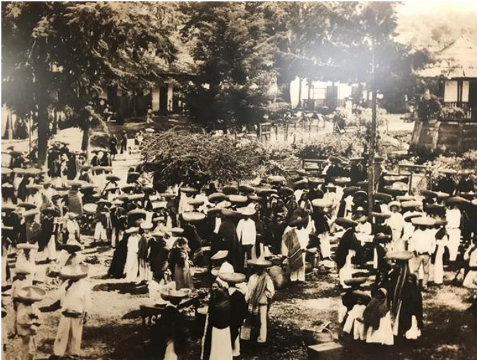
Figura 6. Plaza del Jardín Principal, años 1880-1890. (Casa de la Cultura de Concepción de Buenos Aires "Luis Ochoa Hermosillo").