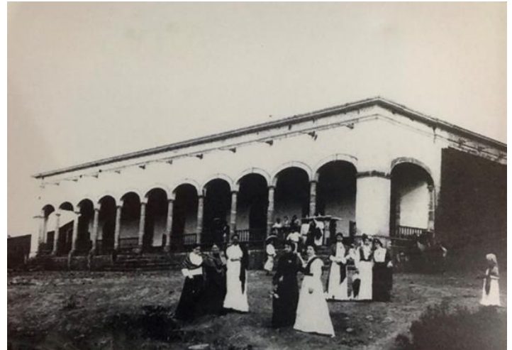
Figura 5. Ex Hacienda de Toluquilla, años 1850-1890. (Casa de la Cultura de Concepción de Buenos Aires "Luis Ochoa Hermsillo").