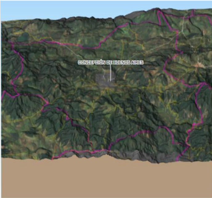
Figura 1. Ubicación con relieve del actual municipio de Concepción de Buenos Aires. (Instituto de Información Estadística y Geográfica de Jalisco. Geografía y Medio Ambiente. Municipios: Concepción de Buenos Aires, Mapa 3D).

Sebastián fuera "Buenos Aires", ya que el relieve condiciona las características climáticas de los distintos factores que regulan el viento. Tal como se observa en el siguiente mapa: