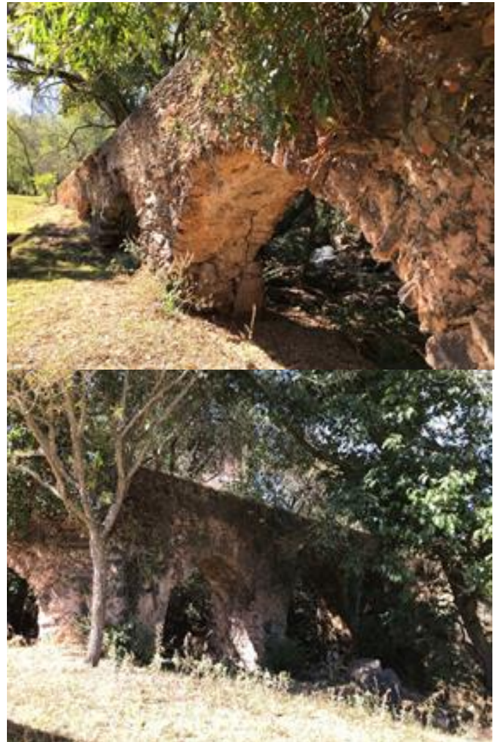
Figuras 2 y 3. Vestigios del acueducto de la ex- Hacienda de Toluquilla, data del siglo XVII.

Marx nos dice, dentro del marco conceptual del materialismo histórico que las relaciones jurídicas tienen raíces en las condiciones materiales de la vida. La conformación y consolidación de la oligarquía regional de este tiempo está directamente relacionada con la posesión de los medios de producción, de la mano de obra ranchera y el usufructo de los recursos para el acumulamiento del capital.